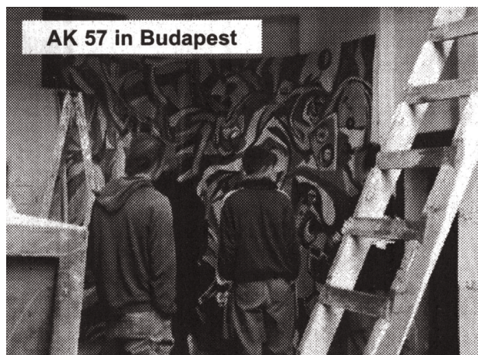
AK 57 in Budapest