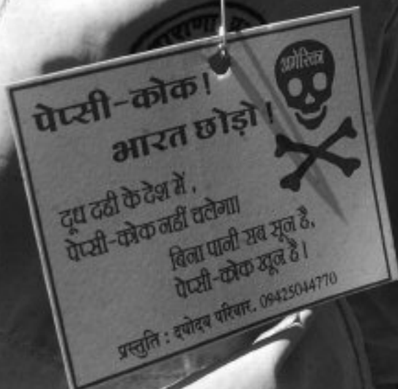
Niños agarrados de la mano en una protesta contra la contaminación del agua por parte de Coca-Cola

Por si fuera poco, un mes después de que Coca-Cola lanzara el ‘agua purificada de grifo’ Dasani, en el Reino Unido se descubrieron niveles ilegales de bromuro cancerígeno. La empresa tuvo que retirar del mercado 500.000 botellas y cancelar el lanzamiento de la bebida. 10