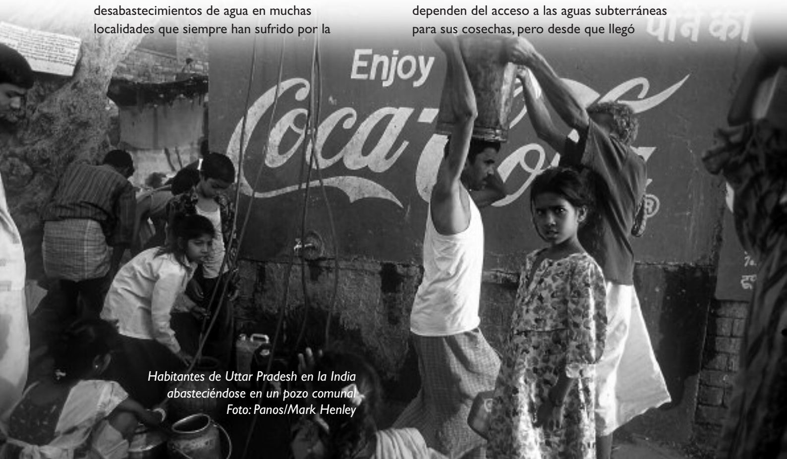
Habitantes de Uttar Pradesh en la India abasteciéndose en un pozo comunal

Coca-Cola abrió una planta embotelladora en el pueblo de Kaladera en Rajastán a finales de 1999. Rajastán es conocido como el estado desierto y Kaladera es un pueblo pequeño y empobrecido que se caracteriza por sus condiciones semiáridas. Los agricultores dependen del acceso a las aguas subterráneas para sus cosechas, pero desde que llegó