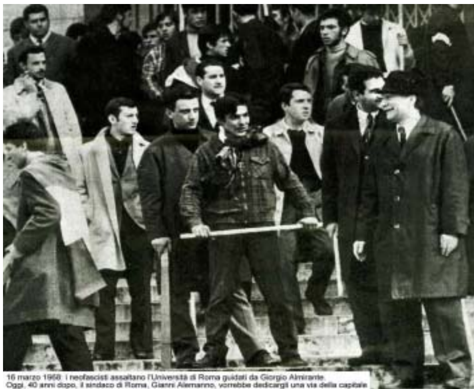
16 marzo 1968. I neofascisti assaltano l'Università di Roma guidati da Giorgio Almirante. Oggi, 40 anni dopo, il sindaco di Roma, Gianni Alemanno, vorrebbe dedicargli una via della capitale.

Diciamo che probabilmente c'era da aspettarselo che la giornata del 29 ottobre facesse scattare nel circuito del neofascismo l'evocazione di questa sorta di luogo della memoria che è la cosiddetta battaglia di Valle Giulia. Nella retorica di destra c'è una sorta di terreno vergine in cui i neofascisti avrebbero rotto